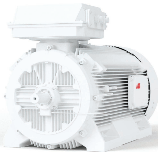
ABB Ability™ Smart Sensor es una solución de monitoreo de condición que hace posible la mantención predictiva para casi todos los motores de baja tensión. Monitoreando y analizando los datos de los parámetros operacionales del motor, permite a los usuarios optimizar su mantención. La solución ayuda a reducir el tiempo de inactividad hasta en un 70%, extiende la vida útil del motor hasta en un 30% y reduce el consumo de energía hasta en un 10%.